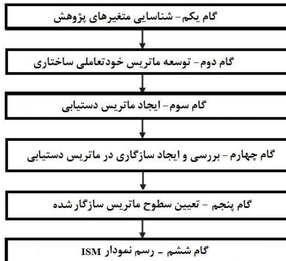
شکل ۱- مراحل اصلی مدل‌سازی ساختاری تفسیری

وارفیلد (۱۹۷۴) رویکرد مدل‌سازی ساختاری تفسیری را توسعه داد که برای تصویرسازی ساختار سلسله‌مراتبی از یک سیستم پیچیده استفاده می‌شود. از این رویکرد برای تحلیل و حل مشکلات در تصمیم‌گیری استفاده می‌شود. فرآیند مدل‌سازی ساختاری تفسیری مدل‌های نامفهوم و ضعیف از سیستم‌ها را به مدل‌های مفید واضح و خوب تعریف‌شده برای بسیاری از مقاصد تبدیل می‌کند. همچنین به شناسایی روابط میان متغیرهای تحت بررسی کمک می‌کند. متدولوژی مدل‌سازی ساختاری تفسیری بر اساس تصمیم و قضاوت گروهی ارتباط میان متغیرها و چگونگی ارتباطات را نشان می‌دهد. این رویکرد ساختاری است بنابراین ساختار کلی مستخرج از مجموعه پیچیده متغیرها را بر اساس روابط می‌باشد. (چین و راج، ۲۰۱۶) مراحل اصلی مدل‌سازی ساختاری تفسیری به شرح زیر است (شکل ۱):