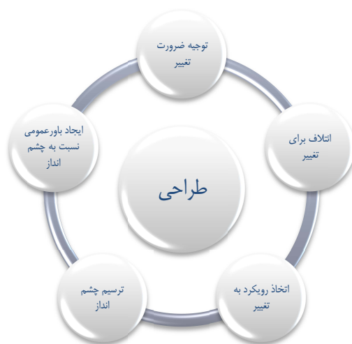
شکل ۲- مرحله ذهنیت‌ها در فرایند مدیریت تغییر

با مرور و تحلیل ادبیات مدیریت تغییر و مدل‌های عمده تغییر که شرح آنها پیش‌تر آمده است و همچنین در نظر گرفتن ساز و کارهای انجام کار در شهرداری مدل زیر به عنوان مدل مفهومی تحقیق طراحی گردیده است. تلاش گردیده در این مدل ماهیت کار در سازمان‌های دولتی ایران، به ویژه در شهرداری، مدنظر قرار گیرد و مدلی مناسب با روند فعالیت‌ها در این نوع سازمان‌ها ارائه شود. در این مدل از مدل مشهور کاتر که در ادبیات مورد توجه ویژه قرار دارد بهره گرفته شده و شرایط و مقتضیات خاص شهرداری در آن لحاظ گردیده است. این مدل در حقیقت به حوزه ذهنیت‌های مجریان تغییر اشاره دارد که شامل ۵ بعد می‌باشد.