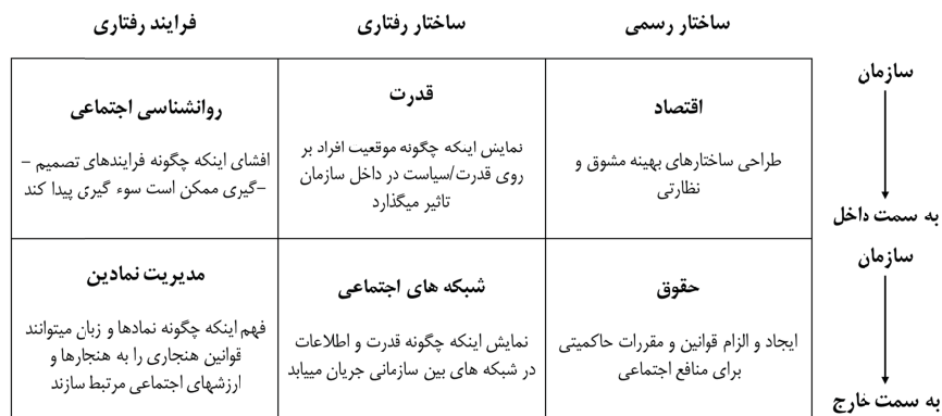
شکل ۱. رویکردهای گوناگون درباره حاکمیت شرکتی،

(Hambrick et al., 2008)، اقتباس از (Zajac & Westphal, 1998)