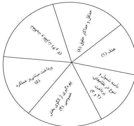
شکل ۱- مدل تحلیل مقایسه‌ای نظام جبران خدمت (تدوین از نویسندگان)

در این بخش اصول عام جبران خدمت برگرفته از تجربیات کشورها ۲۹ و از طریق مدل شش وجهی تحلیل مقایسه‌ای (شکل ۱) استخراج شده است، بدین شکل که با بررسی و مقوله‌بندی آثاری که درباره جبران خدمت در سایر کشورها منتشر شده، محورهای اصلی مورد پرسش در جبران خدمت در کشورهای مختلف مورد مقایسه قرار گرفته است.